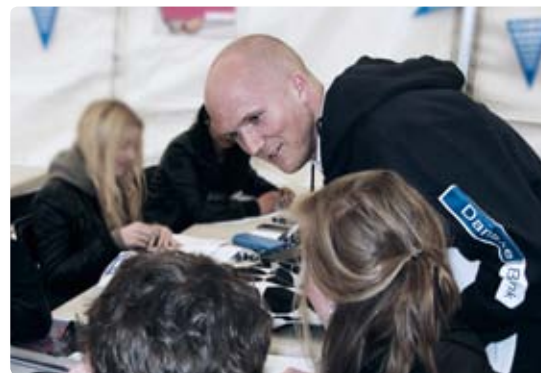
Medarbetare från Danske Bank som volontärer på "Matte på Plattan", ett årligt konvent arrangerat av Mattecentrum där 300 gymnasieelever får hjälp att räkna matte.

Läs mer om Mattecentrum på www.mattecentrum.se