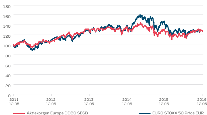
Indexerad utveckling de senaste fem åren 10)